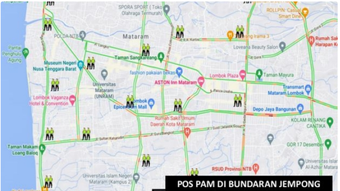
Personel yang Disiagakan pada Pos Pengamanan dan Pos Penyekatan, (04/11)

Mataram NTB - Mendukung terselenggaranya event Internasional Word Superbike (WSBK) Mandalika 2022 berlangsung sukses, ribuan personel akan disiagakan di dalam wilayah pulau Lombok, untuk itu para penonton tidak perlu khawatir.