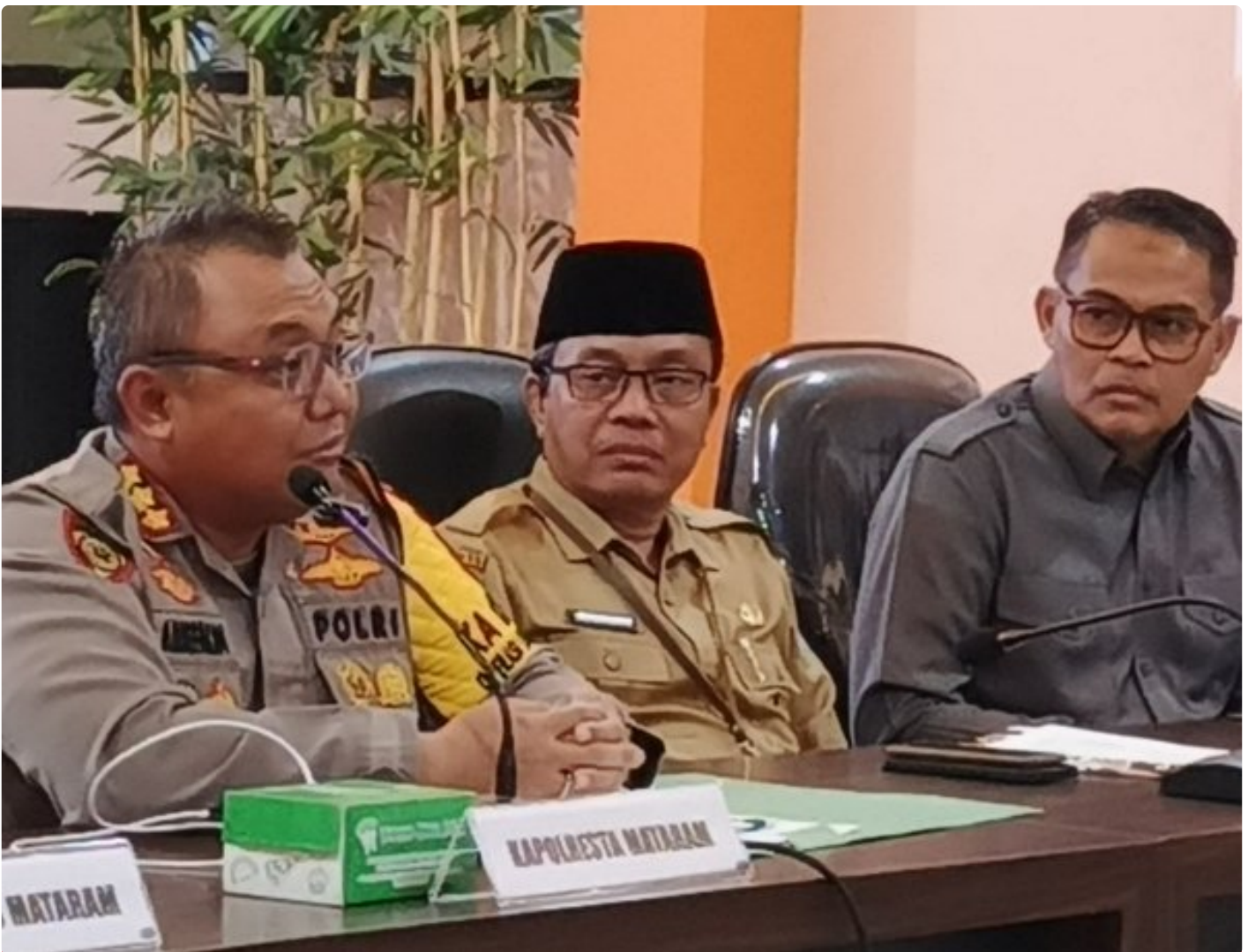
Kapolresta Mataram (Kiri) saat memimpin Konferensi pers akhir tahun, Selagi (31/12/2024)

MATARAM, NTB – Polresta Mataram mengakhiri tahun 2024 dengan menggelar Konferensi Pers Akhir Tahun, sebuah forum transparansi untuk memaparkan